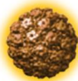
HPV 18 型